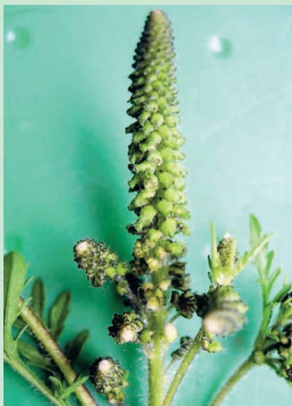
Il periodo principale di fioritura dura da agosto a settembre. Le piante più precoci possono però fiorire già a partire dalla seconda quindicina di luglio, mentre quelle più tardive possono fiorire fino ad ottobre.