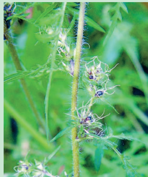
I primi semi giungono a maturazione all'inizio del mese di settembre.