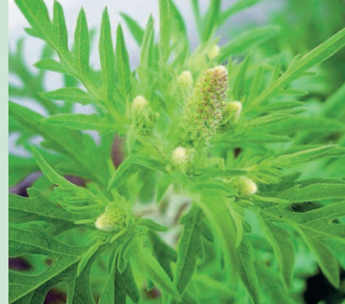
In luglio le piante più precoci cominciano a fiorire; le infiorescenze diventano visibili.