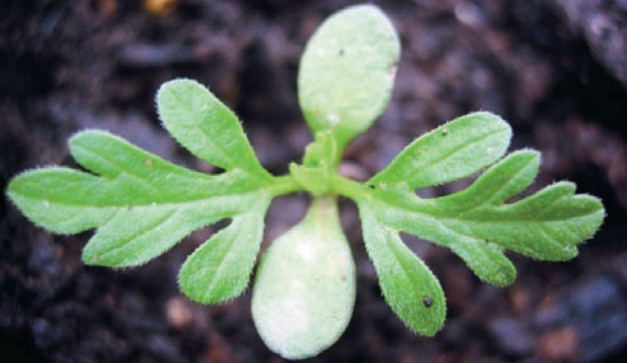
I germogli sono presenti da metà aprile a inizio settembre. Il periodo principale di germinazione dura da metà aprile a metà giugno. In caso di lavorazione del terreno, la germinazione può protrarsi fino all'inizio del mese di settembre.