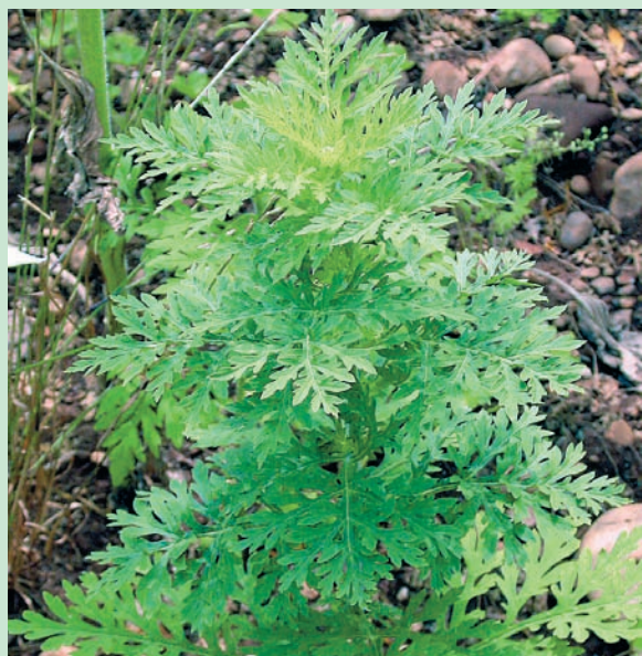
In giugno la pianta inizia a formare ramificazioni laterali e si allunga.