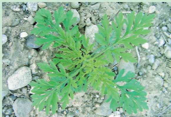
A fine maggio le prime piante raggiungono i 10-15 cm di altezza.