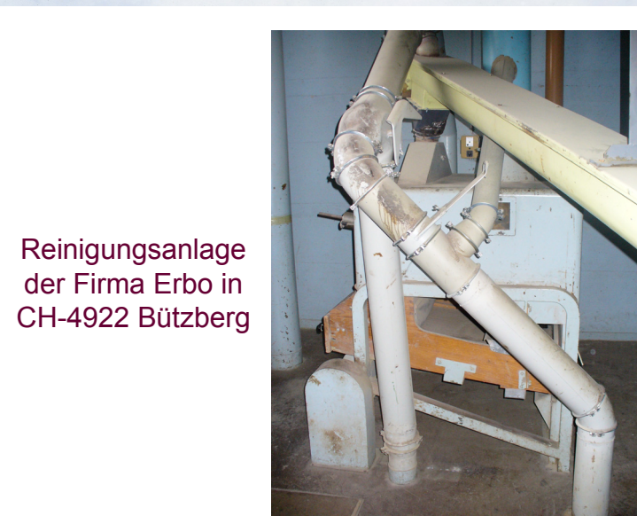
Reinigungsanlage der Firma Erbo in CH-4922 Bützberg

In Rohstoffen, wie Sonnenblumen, Sorgho Hirsen können Ambrosiasamen als Verunreinigung vorkommen. Sie sind sehr heterogen verteilt.