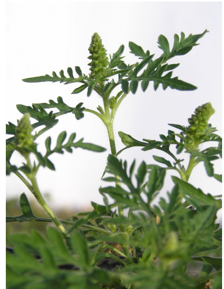
Ab Mitte Juli Blütenbildung und Pollenflug